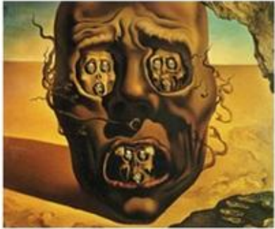
το πρόσωπο του πολέμου