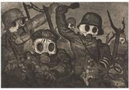
στρατεύματα προελαύνουν μέσα σε αέρια