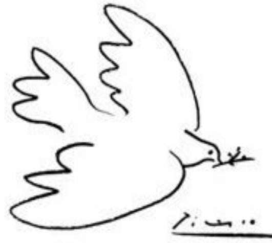
ΤΟ ΠΕΡΙΣΤΕΡΙ ΤΗΣ ΕΙΡΗΝΗΣ, ΠΑΜΠΛΟ ΠΙΚΑΣΟ

Ο θάνατος του φίλου του Καζατζέμας υ ενέπνευσε τον Πικάσο να περάσει στη γαλάζια περίοδο (1901-1903), μια πένθιμη περίοδο για τον ίδιο. Η σύλληψη του παιδιού με το περιστέρι είναι μία σύνδεση της παιδικής αθωότητας με την ειρήνη, την αγνότητα και την ελπίδα για τη ζωή.