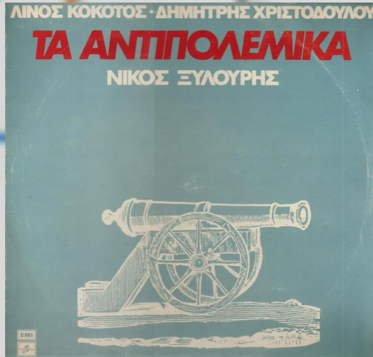
Τον πόλεμο τον κάνουνε – Νίκος Ξυλούρης (1978)