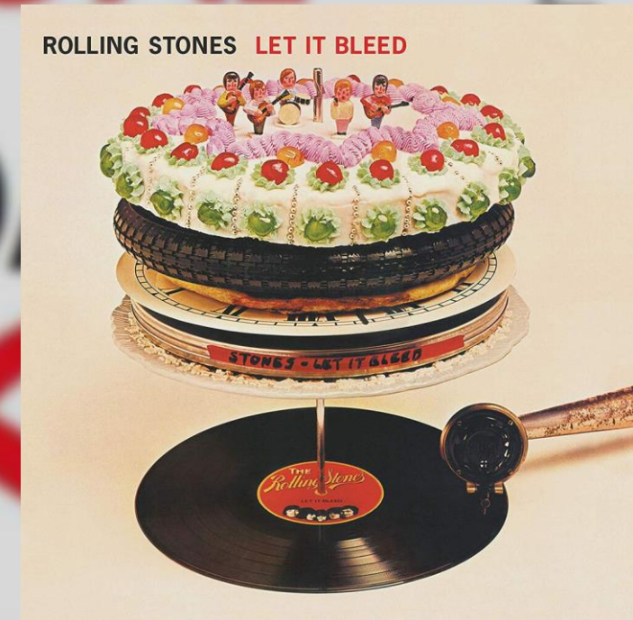
Gimme Shelter – Rolling Stones Let it Bleed (1969)