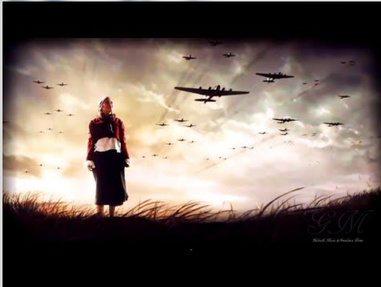
War Pigs – Black Sabbath (1970)